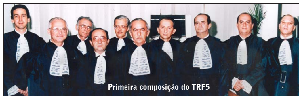
Primeira composição do TRF5