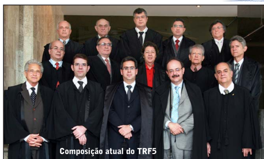
Composição atual do TRF5