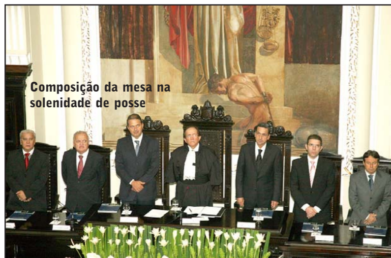
Composição da mesa na solenidade de posse