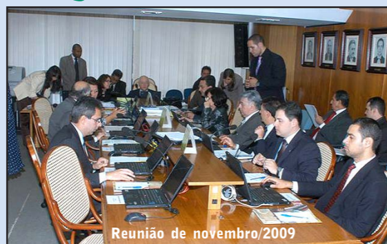
Reunião de novembro/2009

O Conselho da Justiça Federal (CJF) se reúne, amanhã, em Brasília, para deliberar sobre assuntos administrativos e orçamentários da Justiça Federal de 1º e 2º graus. A sessão contará com a participação do ministro Luiz Fux como membro efetivo, eleito no início deste mês pelo Pleno do