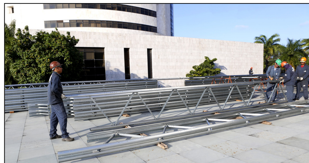
OBRAS Iniciada a montagem da estrutura de suporte do teto do Pleno