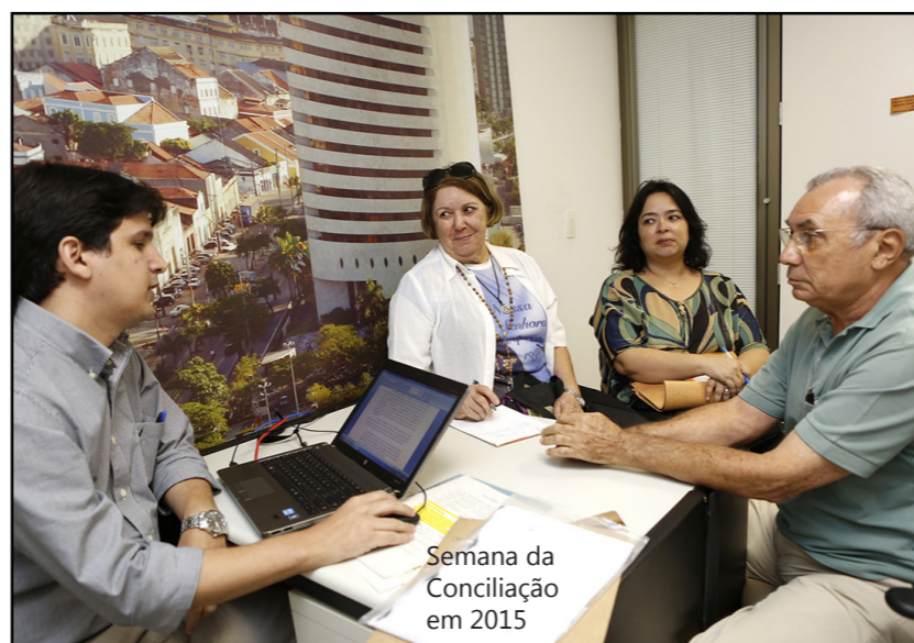
Semana da Conciliação em 2015