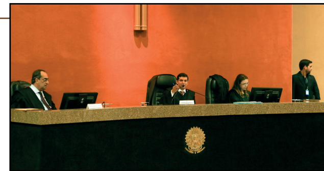
será o representante do TRF5 na sessão ordinária do Conselho da Justiça Federal, em Brasília.